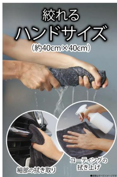
取り回しがしやすいハンドサイズで、細部の拭き取りやコーティングの拭き上げにも使いやすい