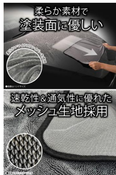
強くこすらなくてももしっかり吸収するため、コーティング車にも最適。片面がメッシュ仕様で乾きやすい