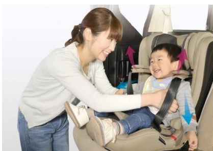
ジャンピングハーネス (画像は『エールベベ・パパット グランス』)

パパットシリーズは“ぱぱっと”取り付け、“ぱぱっと”乗せ降ろしができる”をコンセプトとしたチャイルド&ジュニアシートです。肩ベルトが跳ね上がった状態をキープする「ジャンピングハーネス」※が、お子様の腕をベルトに通しやすく乗せ降ろしがしやすくと好評を得ています。