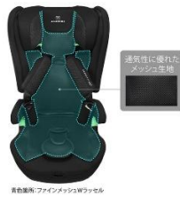
画像箇所：ファインメッシュWワッセル