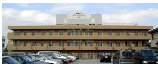
グレースメイト松戸