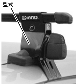
品番 IN-SU 型式 INSU

平成21年12月1日 東京都豊島区长崎5丁目31番地11号 株式会社 カーメイト 品質保証部長