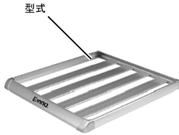
型式 IN569 品番 IN569