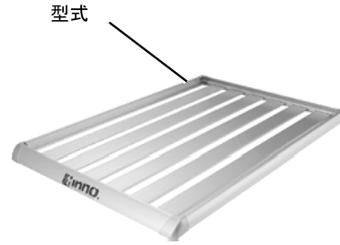
型式 IN569 品番 IN589