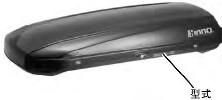
品番 BR1400BK 型式 BR1400

平成21年12月1日 東京都豊島区长崎5丁目31番地11号 株式会社 カーメイト 品質保証部長