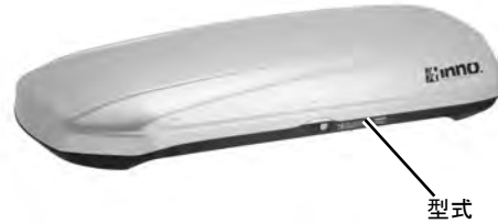
品番 BR1400SV 型式 BR1400